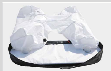
Attaccare la camera d'aria mediante velcro su entrambi i lati della base.