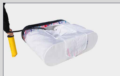
Gonfiare la camera d'aria.