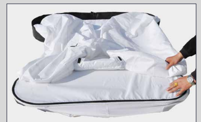
Attaccare la camera d'aria utilizzando velcro su entrambi i lati del ripiano superiore.