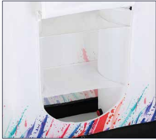
Ripiani interni per deposito oggetti.