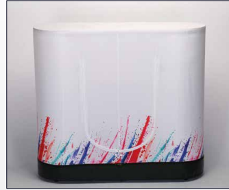
Retro tavolo reception con zip apribile.