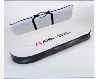
Borsa per il trasporto.