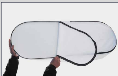
Installare il ripiano superiore tramite la zip.