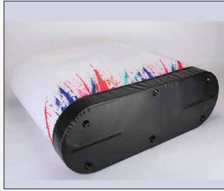
Base 0.45mm PVC tarpaulin.