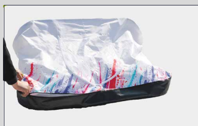
Chiudere le cerniere