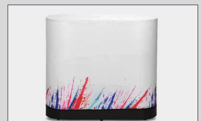
Prodotto pronto all'utilizzo!