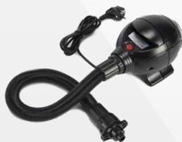
POMPA ELETTRICA 25 kpa (250mbar/3,6 p.s.i) 230V - 50Hz 1000 W